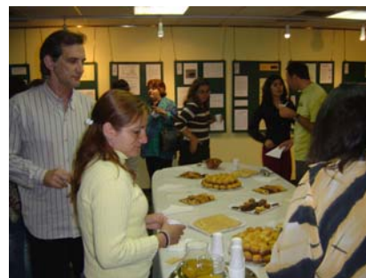
Acte de clausura del seminari de l'APEC