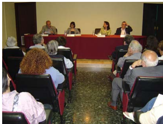
Commemoració del cinquanta aniversari de la publicació de Pedro Páramo

Homenatge al poeta salvadorenc Roque Dalton