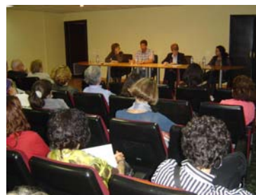
Estrena del format DOCUFORUM