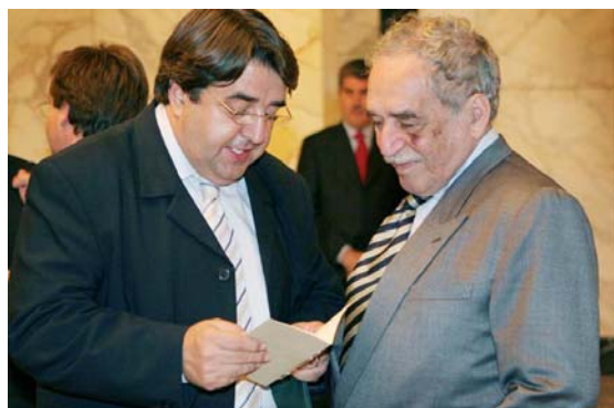
Entrega per part del director de l'ICCI del primer exemplar de la col·lecció MIRADA AMERICA a Gabriel García Márquez

Aquesta nova col·lecció de texts breus editada de manera artesanal per l'ICCI pretén ser una finestra oberta a diferents autors i disciplines. Una mirada transversal, que s'acosti a la realitat llatinoamericana d'una manera original i no necessàriament acadèmica.