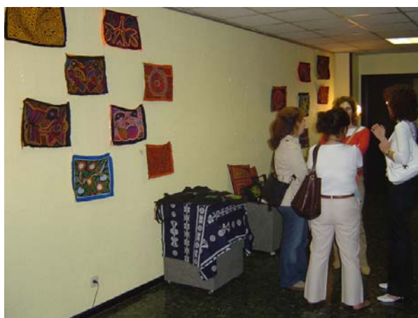
Exposició d'art Kuna en motiu del cicle de conferències "Tres Mirades"